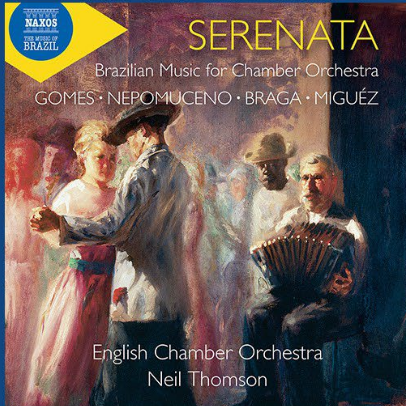
セレナータ（室内管弦楽のためのブラジリアンミュージック） イギリス室内管弦楽団 指揮ニールトムソン 2022年

https://www.naxos.com/CatalogueDetail/?id=8.574405 _