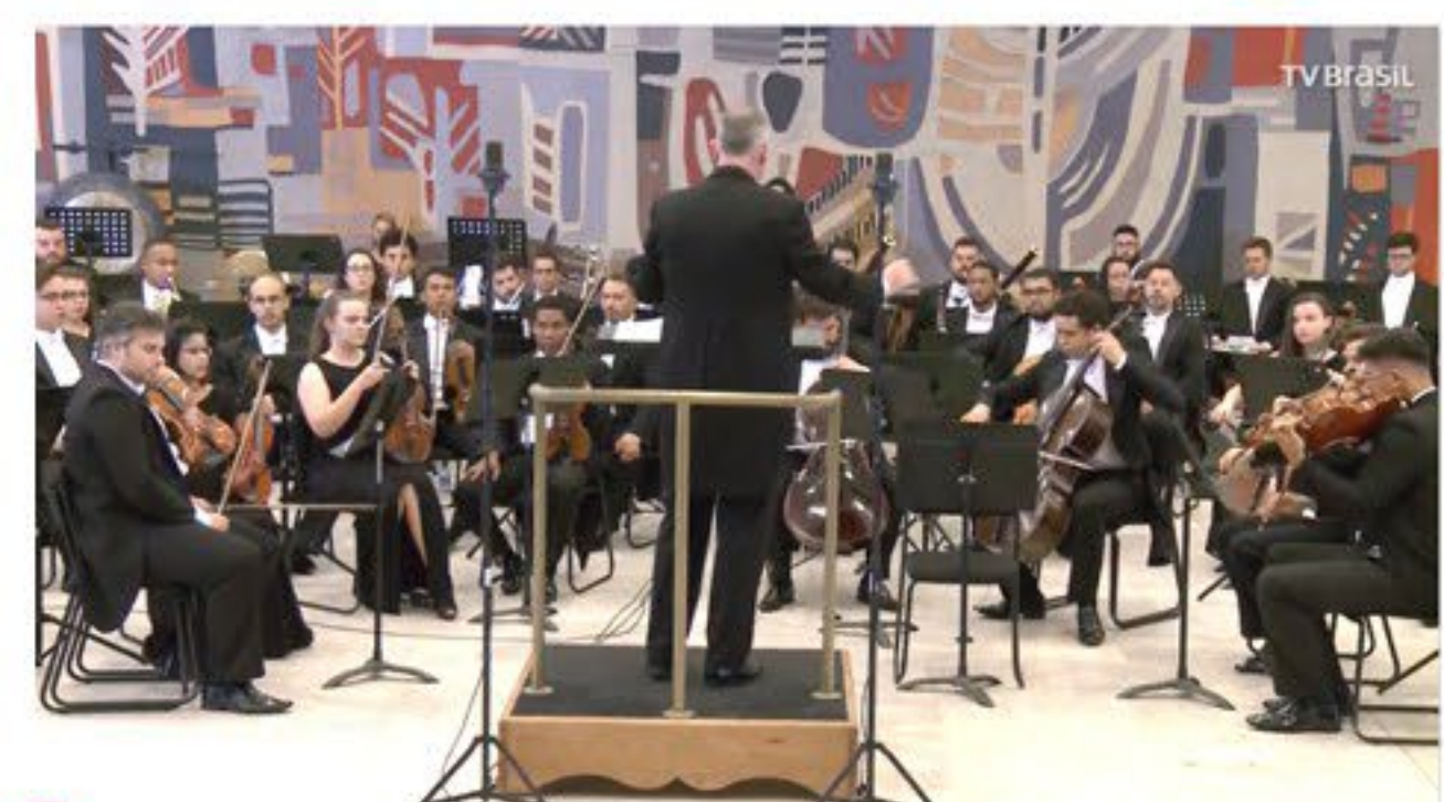
'TV Brasil no Itamaraty' recebe a Orquestra Filarmônica d... tvbrasil