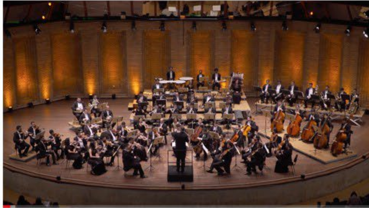
Brahms: Piano Quartet No. 1 (orch. Schoenberg) Neil Thomson