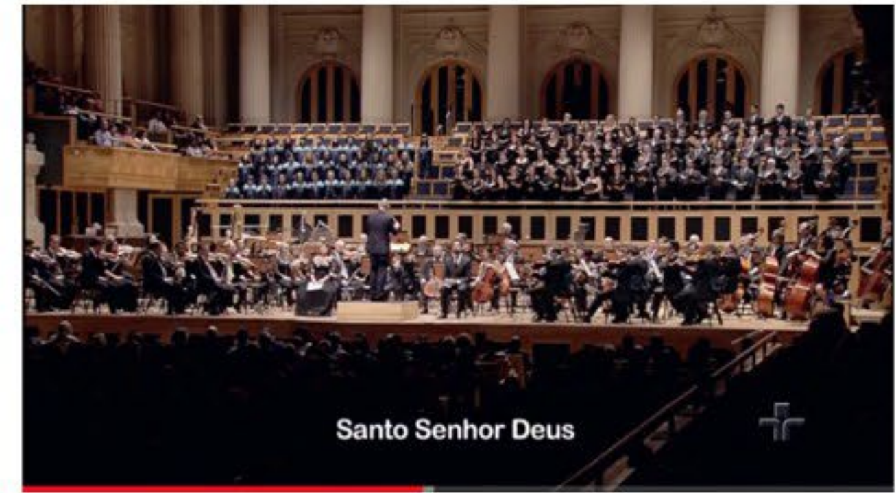
Gabriel Faure's Requiem Op. 48 with Orquestra Sinfônica ... Neil Thomson